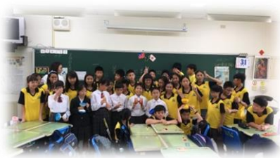
台湾 東華大学附設実験小学校訪問