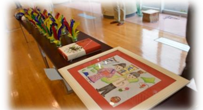
交流会での記念品