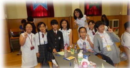
香港 陳守仁小学校訪問